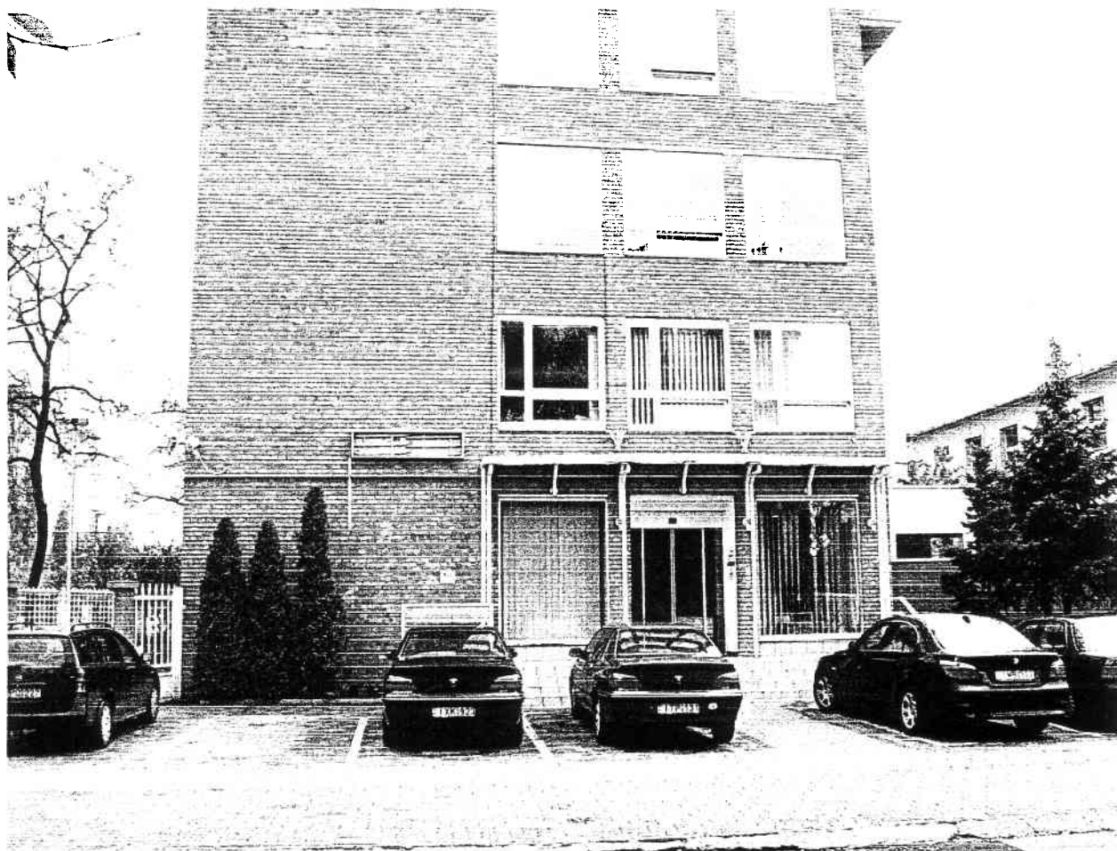
AZ INTÉZET BEJÁRATA A FŐÉPÜLETTEL